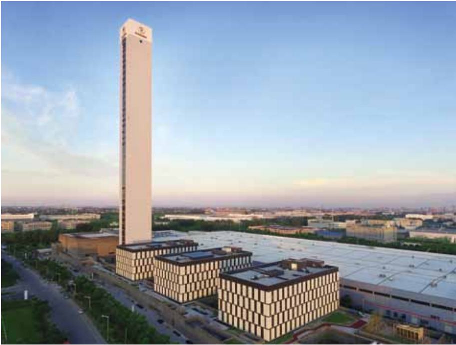
▲ 迅达嘉定园区高 200 米的试验塔

1988年，迅达成立第二家在华合资公司——苏州迅达电梯有限公司；2001年，迅达中国成