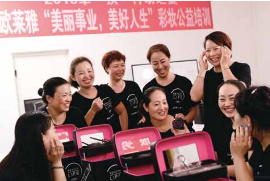
▲ 学员们在“美丽事业，美好人生”公益培训班上

“美丽事业，美好人生”公益培训项目是欧莱雅企业基金会发起的全球支柱项目之一，也是集团“美丽，与众共享”2020可持续发展战略的重要组成部分。该项目旨在为相对弱势的群体提供美的领域的免费专业技能培训，利用企业百年“美”的专长，通过“授人以渔”的创新公益理念，帮助他们获得一技之长的同时，增强自信并更好地融入社会，找到属于自己的一席之地。项目自2009年发起至今，已在30多个国家和地区开展，受益人数超过10,000名。 2015年，欧莱雅中国携手中国妇女发展基金会并达成战略共识，双方计划到2020年前，在全国范围内至少受益8,000名弱势女性。通过“美丽事业，美好人生”所开创的美容美发专业技能培训模式，创新落实精准扶贫工作，重点扶持弱势女性群体，帮助她们在美的行业获得就业甚至是创业的机会，为实现脱贫目标奉献绵薄之力。截止至2019年6月，项目已在全国9座城市建立