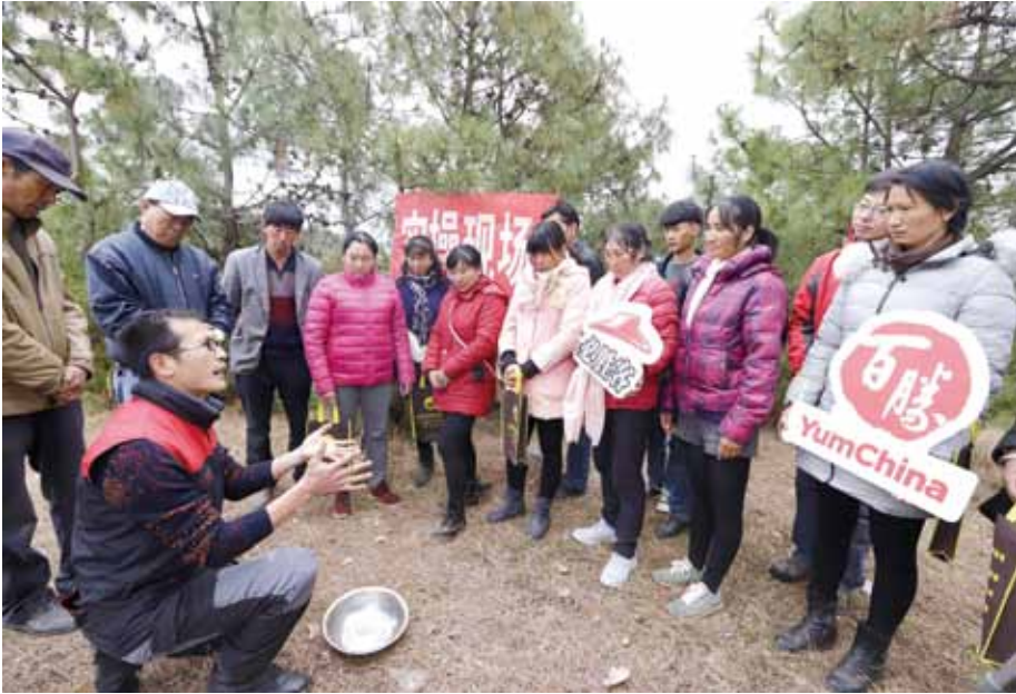
▲ 云南永胜县农民参加松露科学采摘培训课程，并接受专家实地指导

新品，帮助当地企业完善资质和采购规范，完成对云南松露的批量采购。采用云南优质松露的必胜客松露比萨系列产品于当年4月在全国超过必胜客餐厅上市，让广大消费者感受“舌尖上的美味”。