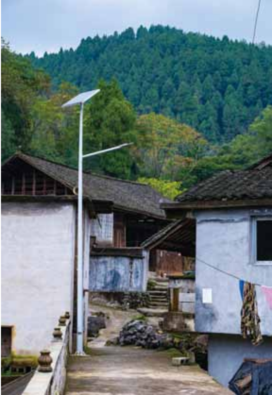
▲ 昕诺飞“点亮未来”项目捐赠的太阳能LED路灯

活动。该项目应用环保节能的照明解决方案，为这四个电力匮乏的山村捐赠了140套太阳能LED路灯，以及2904只LED灯泡，解决了该地区夜间道路照明问题，并改善了家庭照明条件，使1500户家庭的近6000人从中受益。