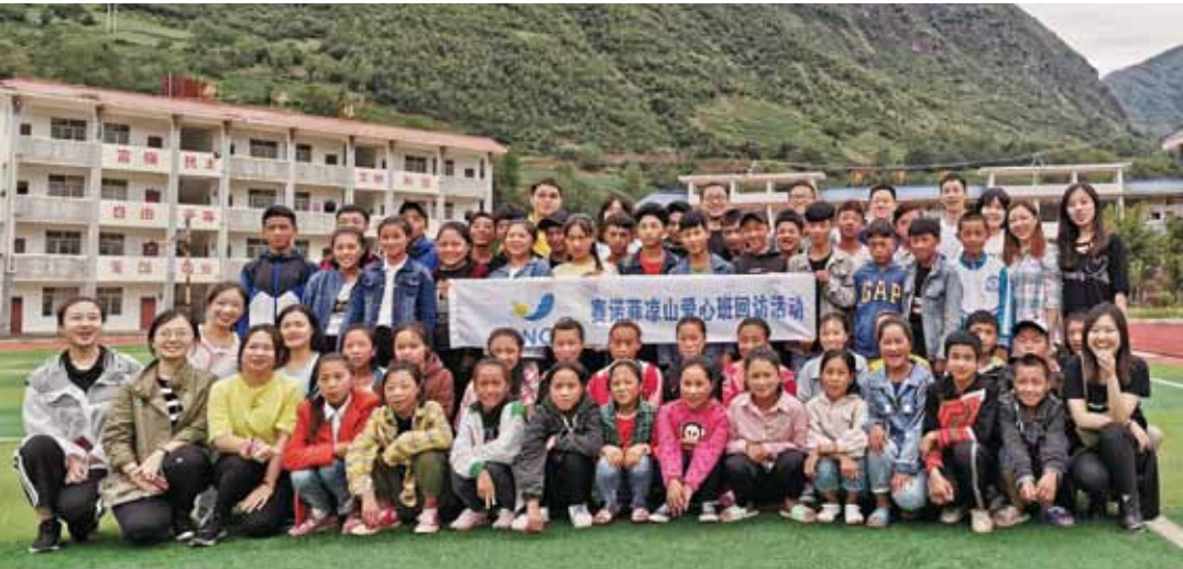
▲ “赛诺菲希望爱心班”凉山探访——部分爱心家长和受助孩子合影

持续支持凉山，校园生活无忧。“赛诺菲希望爱心班”为全寄宿制，全年共计10个月在校生活。项目为每个爱心班学生提供300元月补给，支持孩子们校园寄宿生活中的吃穿用度和健康保