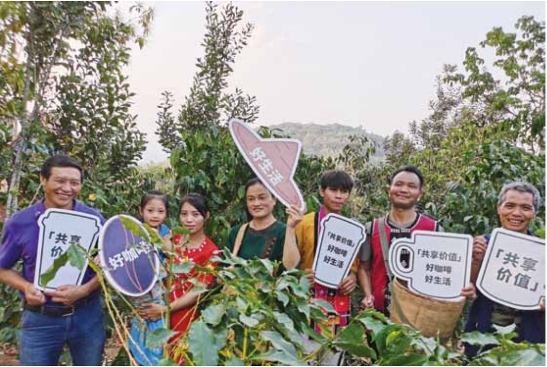
▲ 星巴克与中国扶贫基金会启动咖啡产业扶贫二期普洱项目

多年来，云南咖啡产业扶贫项目已经成为星巴克中国深耕本土市场、回馈所在社区的重要例证。自2012年星巴克在云南普洱建成咖啡种植者支持中心以来，已累计培训22000人次，帮助近1800个咖啡农场通过了“咖啡和种植者公平规范”认证，认证总面积逾17200公顷。未来，星巴克还将持续推进云南咖啡产业扶贫计划，从源头提升咖啡品质，为种植出优质咖啡豆的咖农带来更丰厚的回报。