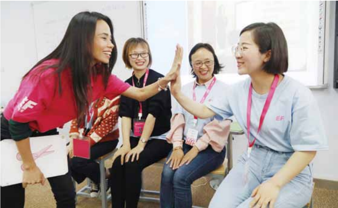
成都线下集中英语教学技能专项培训现场