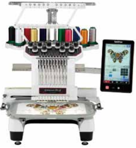
▼ Brother 商用自动绣花机，满足个性化的刺绣需求

如今，Brother产品已遍布世界各地，而企业精神从未被淡忘。市场正经历着工业时代向数据时代的跨越，技术革命带来的影响远远超过大家的想象，中国的变化更是举世瞩目。兄弟(中国)顺应中国社会和技术的发展，通过技术创新来应对中国市场的变化。兄弟（中国）将继续和Brother集团在中国的研发基地——滨江兄弟信息技术(杭州)有限公司携手，通过强化价值革新来快速应对中国顾客的特殊打印需求，提供更多真正适合中国的新商品和解决方案来满足用户的需求，同中国市场谱写更加精彩辉煌的新篇章。