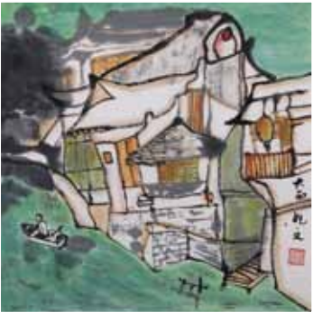
大西妃文《嘉定古城》50x50cm (已售)