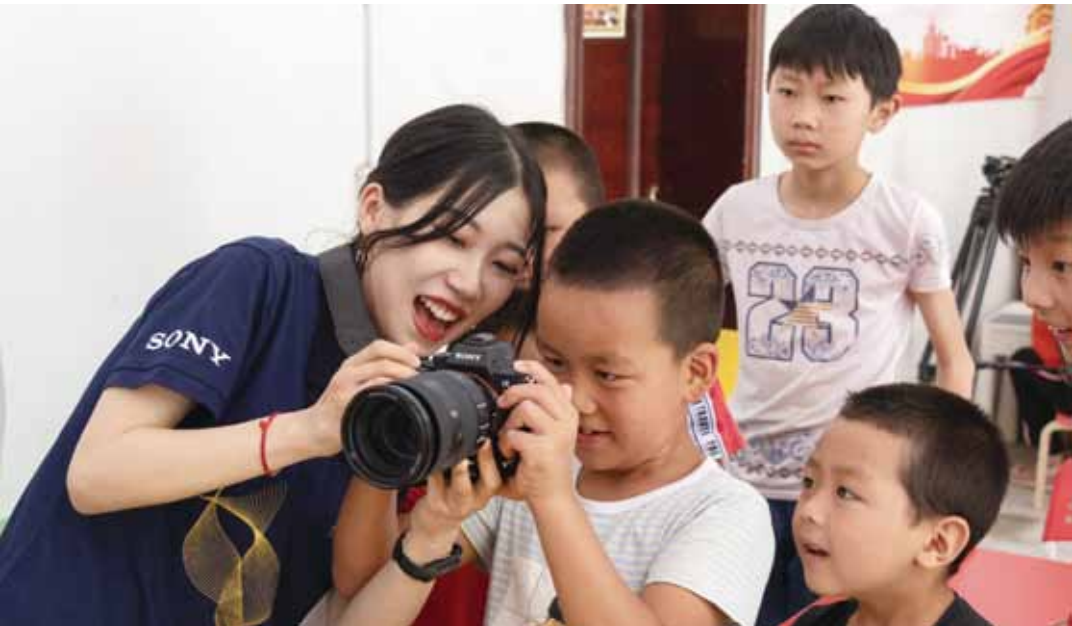
索尼“梦想教室”课堂上志愿者老师教小朋友摄影

索尼中国副总裁伊东祐表示：自在中国开展业务以来，索尼认真履行企业社会责任，在环境、教育等方面持续投入，力求为下一代创造更好的成长环境。“索尼梦想教室”积极响应“精准扶贫”政策，希望在一些欠发达地区建立更多梦想教室，助力教育扶贫，为更好的明天和孩子们更灿烂的笑脸而不断奋斗！