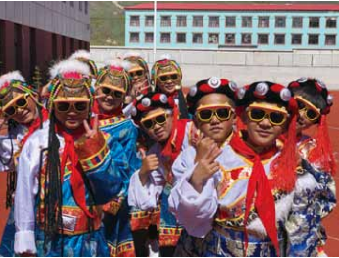
▲ 孩子们戴上太阳眼镜防护紫外线

2015年初开始，依视路基金会开始和“点亮眼睛”公益组织合作，共同在云南省开展视觉健康公益计划。五年来，“睛彩童年”公益项目已走进云南香格里拉、云南保山市龙陵县和盈江县、云南昭通市巧家县、楚雄州禄丰县等二十多个县，为近1000所义务教育阶段的中小学生学习开展