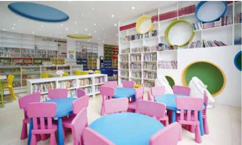
▲ 宜家为石屏县图书馆打造美观、实用、多功能、安全的阅读空间

1943年，英格瓦·坎普拉德先生在瑞典创立宜家品牌。秉承“为大众创造更美好的日常生活”的愿景，宜家致力于提供种类繁多，美观实用，老百姓买得起的家居用品。自1998年在上海开设了大陆地区第一家商场以来，宜家目前在中国大陆运营着31家商场、1家小型商场、1家城市店、2家体验店、4个分拨中心和7个配送中心，电子商务业务已覆盖227个中国城市。2020年3月，宜家天猫旗舰店正式上线。